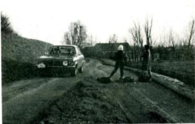
Construeren over op de kaart staande boze boeren- weggetjes....