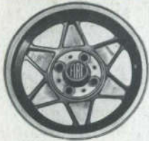
Still-auto, lichtgewicht 6 J x 13", voor vele merken f 181,- 6 J x 14", BMW-Alfa Romeo f 220,-