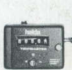
Halda Tripmaster f 250,-

Leden autosportclubs speciale condities!