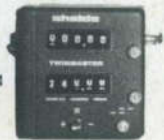
Halda Twinmaster f 370.50