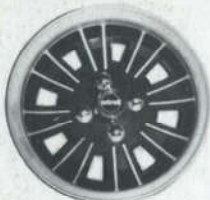
Astrali, lichtgewicht 5 1/2 J x 13" naar buiten ver- breed f 159,- incl. verchr. moeren