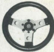
Indianapolis leren stuur 31, 33, 35 en 38 cm. f 99.50 mat zwart of aluminium