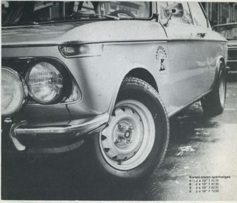
Borani-stalen-spórtvelgen 5 1/2 J x 13" f 62.50 6 J x 13" f 67.50 5 J x 10" f 52.50 6 J x 14" f 72.50